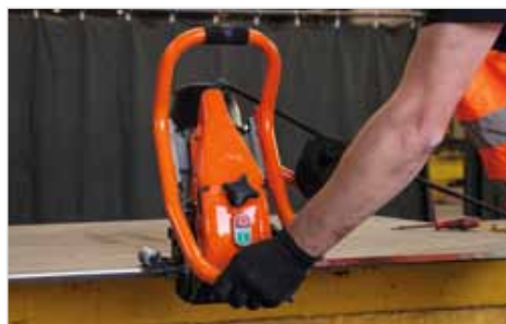
Configuração rápida e bloqueável da máquina