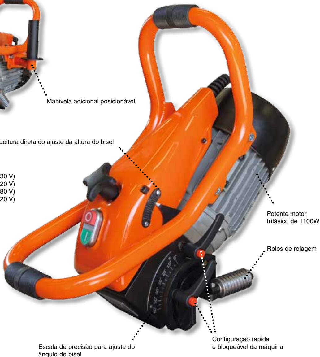
Potente motor trifásico de 1100W

P/N: 29220 (1Phase - 230 V) P/N: 29221 (1Phase - 120 V) P/N: 29211 (3Phase - 480 V) P/N: 29212 (3Phase - 220 V)