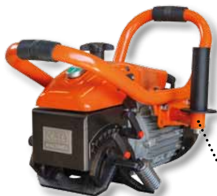
Manivela adicional posicionável