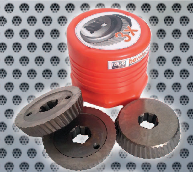
Art. Nr. 1928 set of 3 cutters UZ12 Art. Nr. 1927 (price advantage)