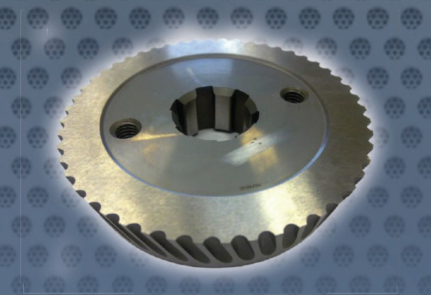
Art. Nr. 2135 - CEVISA