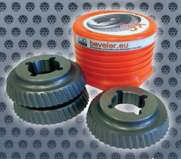
Art. Nr. 2134 set of 3 cutters UZ15 ECO Art. Nr. 2137 (price advantage)