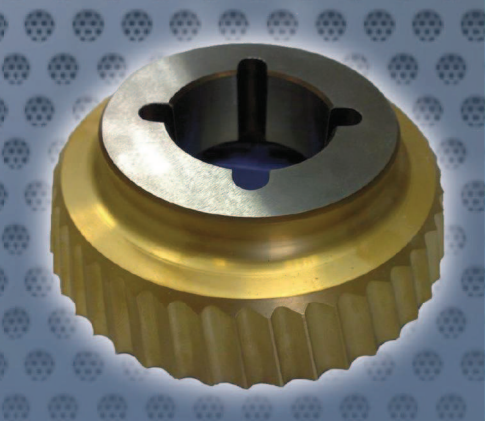
Art. Nr. 2136 - cutter UZ15